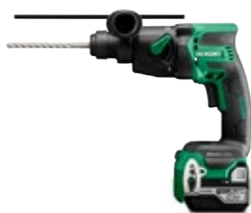
18V Borrhammare DH18DPB