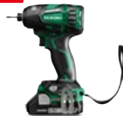
18V Slagskruvdragare Oilpuls WHP18DBL