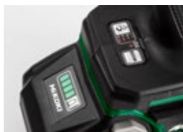
Display med fyra inställbara varvtal/ slagtal samt batteriindikator.