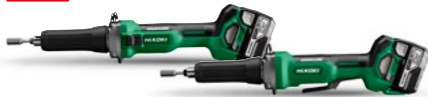
18V Rakslip GP18DA och GP18DB