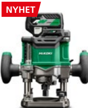
36V Handöverfräs M3612DA