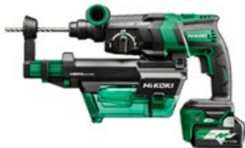
36V Kombihammare DH36DPE