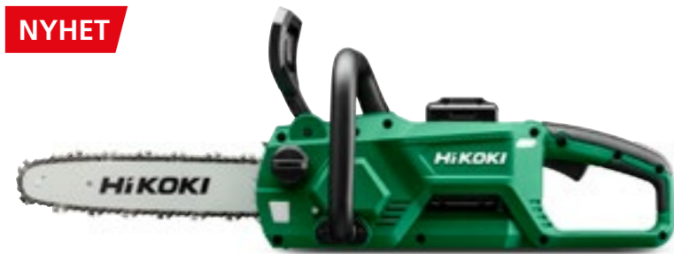
36V Kedjesåg CS3630DB och CS3635DB