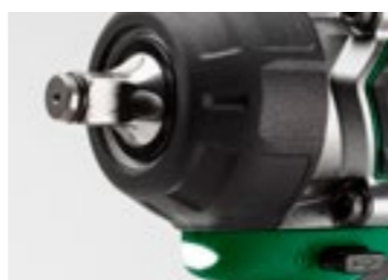
1/2" fyrkantfäste och integrerat LED-ljus.

Finns även som WR36DE Tool only i förvaringsväska HSC II. 2990.00 3738.00 inkl.moms