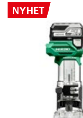
18V Kantfräs M1808DA