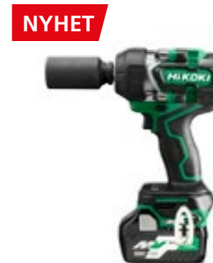
36V Mutterdragare WR36DE