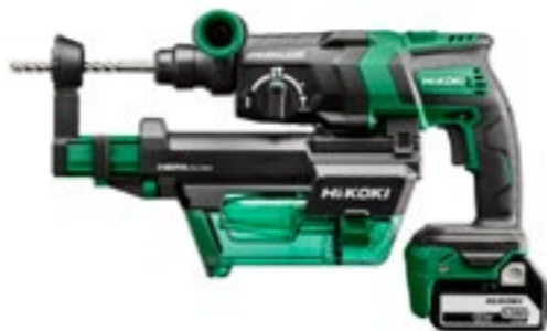
18V Kombihammare DH18DPC