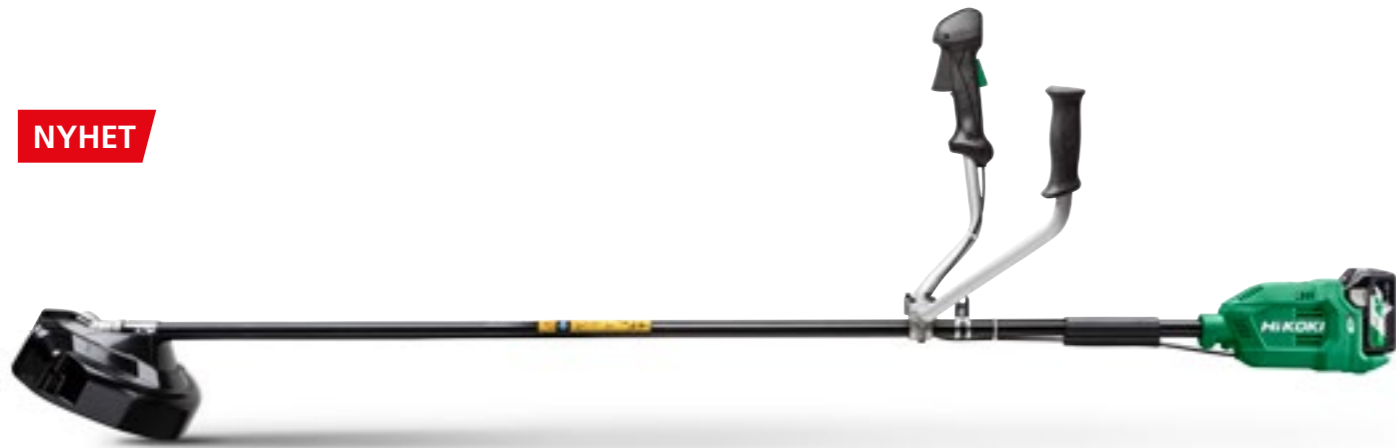
36V Grässtrimmer CG36DB och CG36DBL