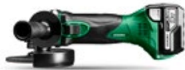
18V Vinkelslip G18DSL2