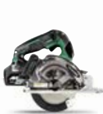
CD3605DA Cirkelsåg för metall