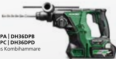
DH36DPA | DH36DPB DH36DPC | DH36DPD SDS-plus Kombihammare