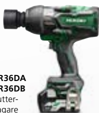
WR36DA WR36DB Mutterdragare