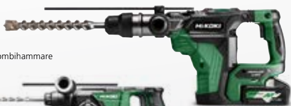
DH36DMA SDS-max Kombihammare