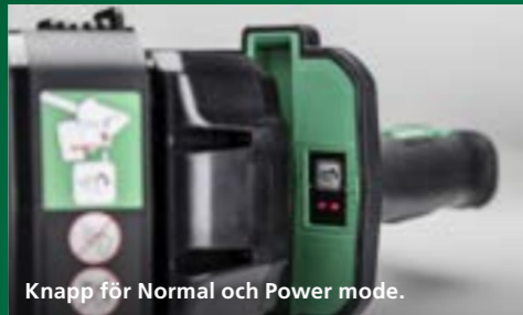
Knapp för Normal och Power mode.