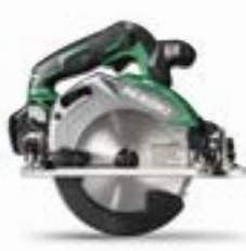
C3605DA | C3606DA | C3607DA Cirkelsågar